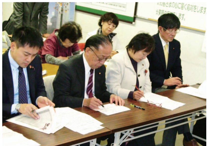
左側からたつみコータロー参議院議員と羽曳野市会議員団